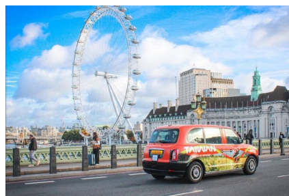
臺灣主題計程車穿梭倫敦市區。

英國最具影響力的旅遊雜誌《Wanderlust》11月公布2024年讀者票選的最佳旅遊地點，臺灣以美食、文化和自由氛圍、自然景觀、戶外健行及生態體驗等擄獲遊客的心，榮獲「全球最嚮往旅訪島嶼」銀獎，這也是臺灣連續2年獲得此獎。據觀光署統計，英國目前是臺灣在歐洲最大的觀光旅遊客源，為了加強推廣赴臺旅遊，觀光署在11月至12月於倫敦進行各種創意宣傳，包括讓50輛橘色的臺灣主題計程車穿梭倫敦市區載客、推出乘客掃QR code參加機票抽獎的活動、結合當地的臺灣品牌業者舉辦產品體驗活動等。除了這些推廣活動外，觀光署也在其英國的IG官方帳號發起獲獎後的慶祝活動，引起廣大迴響，成功引發英國民眾對臺灣的興趣。觀光署表示，獲獎殊榮與這些品牌活動不僅是行銷推廣，也促進了臺灣與國際市場的連結，未來將持續強力宣傳臺灣之美，邀請全球旅客前來探索臺灣的獨特魅力。