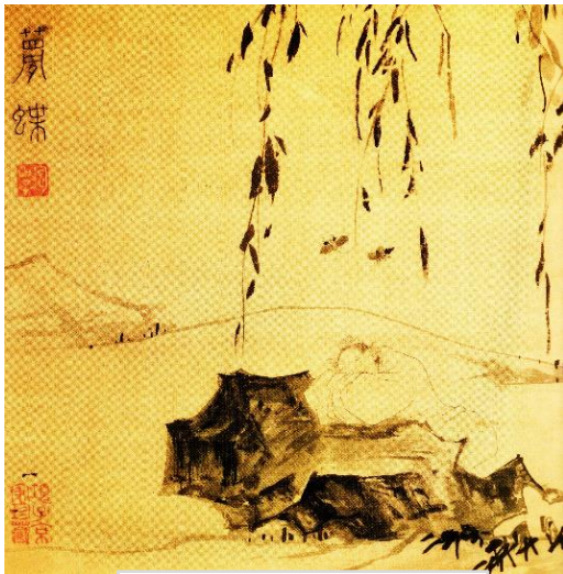
明代陸治所繪〈夢蝶〉

對於這個哀戚的故事，現在的學者推測可能是因為杜鵑鳥的口腔上皮和舌頭都是紅色的，古人才誤以為牠啼叫到滿嘴流血。但無論如何，千百年來，杜鵑鳥在眾多文人的筆下，已經變成了愁苦哀思的象