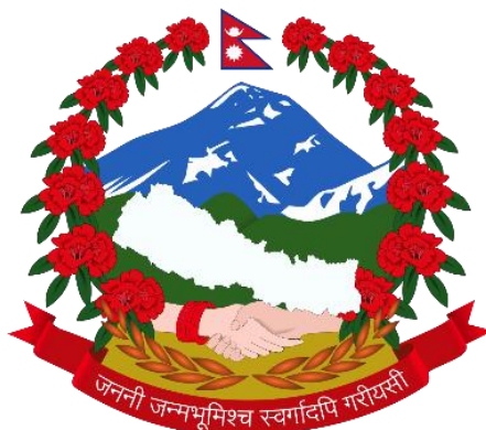
▲尼泊爾的國徽外綴有一圈國花杜鵑花

清明連假正好是杜鵑花開的季節，原本我和姐姐計畫好要帶妳去台北大安森林公園的杜鵑花節賞花，但現在只有妳們兩個能去了。其實，為了去賞花，我還特地做了一些功課呢！像是杜鵑花又叫映山紅、滿山紅，不僅是台北市和新竹市的市花，更是尼泊爾的國花喔！