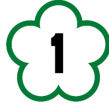
中華民國國道標誌