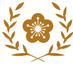
中華民國總統府府徽

正因為梅花潔白芳香、又能夠戰勝酷寒，因此在人們心中，梅花也代表了不怕艱苦、堅強高潔的君子品格，所謂「不經一番寒徹骨，焉得梅花撲鼻香」，就是來自梅花這種越冷越開花的特性，勉勵人們要堅強，克服逆境後才能贏來甜美的果實。我國當初要訂定國花時，也是因為梅花能象徵國人堅忍不拔、奮發自強的精神，所以才決定以梅花作為國花。