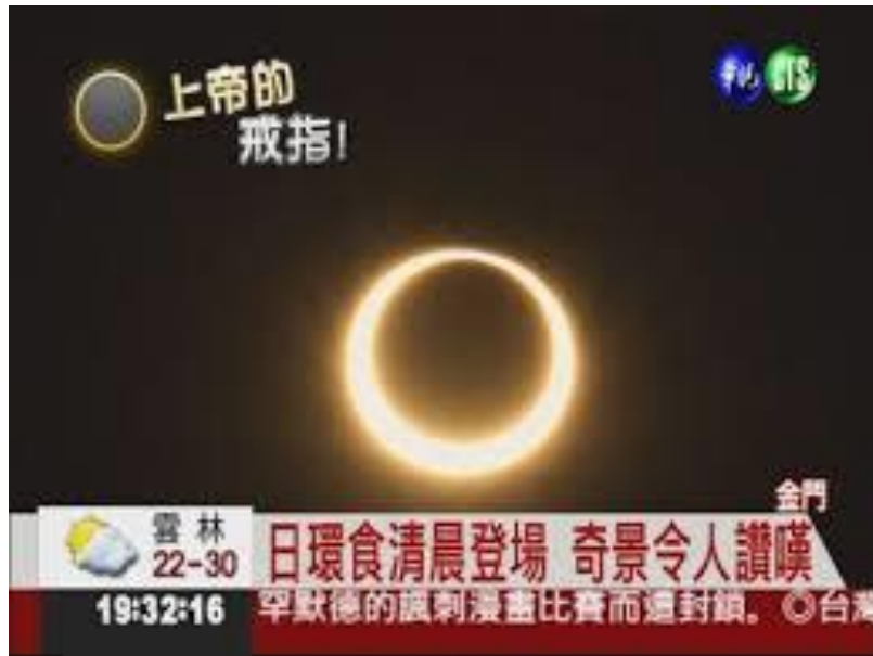
(2012/05/21 台灣 金門日環食)

最後要來討論的「日環食」，因為發生條件較為特別，與日全食相同，是較不常見的日食現象。當地球離太陽最遠，但月球離地球最近時，這時候發生的日食就會是「日環食」了，此時，落在地球表面的僅是月球本影延長而出的偽本影，在視覺上觀來，月球看起來會略小於太陽，太陽的邊緣因無法被月球遮住而被看見，所以日環食發生時，天空看起來就像是懸掛了一個紅色的火環，奇景耀眼迷人，被譽為「上帝的戒指」。