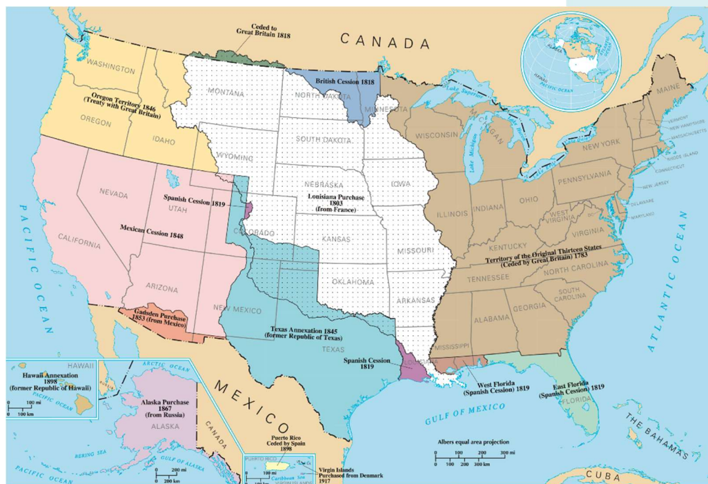
圖 6 十九世紀美國大擴張的時代地圖，最右方是剛獨立時的美國，中間白色區塊就是從法國購買來的土地，剩餘大片土地則是透過戰爭、開墾取得。