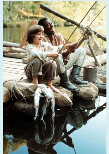
圖 2 另一部描繪美國南北戰爭時代的名作： 《頑童歷險記 ( The Adventures of Huck Finn )》

除了電影，其實博幼推薦閱讀的很多經典小說都與這個時代的美國有關係喔！例如很有名的《湯姆歷險記》、《頑童歷險記》這兩部作品裡就描繪了在奴隸制度下的美國生活與衝突，尤其是《頑童歷險記》中，主角哈克的重要伙伴就是一位黑人奴隸，教師可藉此引導學生閱讀此類相關的書籍，與大量閱讀課程作結合。