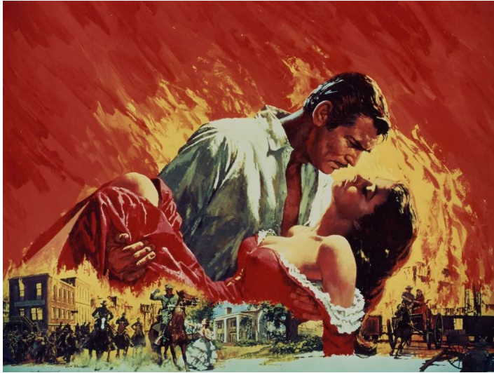
圖 1 在 1939 年以美國內戰為背景的經典電影 《亂世佳人 ( Gone With The Wind )》

今年四月底上映的超級英雄電影《復仇者聯盟四》順利打敗了《阿凡達》，登上全球電影票房排行榜的第一名，但是你知道如果把票房換算成現在的物價的話，有一部電影其實超越了《復仇者聯盟四》嗎？這部電影就是八十年前的經典電影《亂世佳人》。