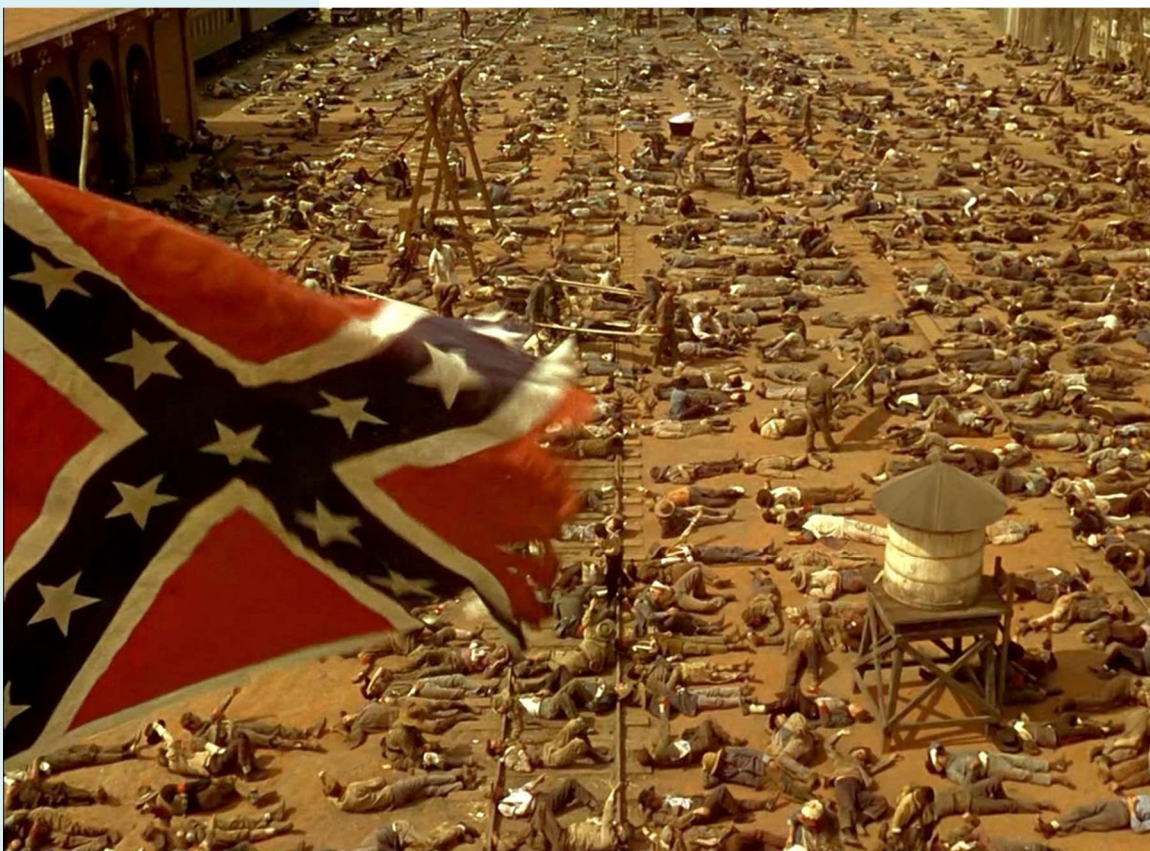
圖 7 《亂世佳人》電影劇照：左方飄揚的就是南方邦聯旗幟下卻是慘烈的傷亡

後來的歷史也證明了，就如傑佛遜所說的，這個充滿爭議的妥協案，正預告了未來南北大戰的開端。