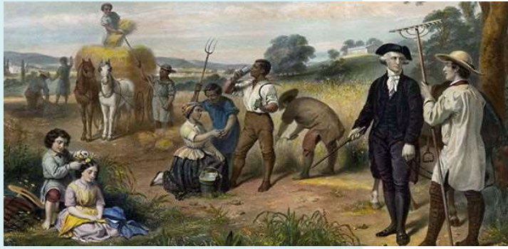
圖 3 華盛頓與華盛頓的農奴