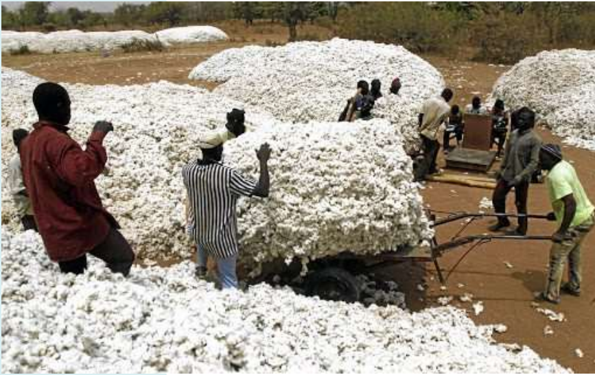
圖 5 收成好的棉花，黑色的小點就是棉籽 生產棉花的困難之一就是分離棉籽

原本憲法中預定 1800 年廢止奴隸貿易，這是制憲思想家們為了讓奴隸制度自然被放棄而設計的措施，但是出乎眾人的預料，1793 年發生了棉花生產技術的大革命，新技術讓棉花生產速度與利潤暴增數倍，棉花需求隨之飆升。奴隸需求大增的同時，在經濟上也大幅度地強化了蓄奴者的實力，讓他們蓄奴的立場更加堅定，因此奴隸制度非但沒有消失，反而變成一種本土產業，更強化了美國南北的對立，這是憲法制定者始料未及的大變化。