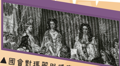
▲國會對瑪麗與威廉宣讀權利法案

大家要注意喔，這裡指的是「權利」而不是「權力」，權利是對我們自己擁有的事物的保障，「權力」則是一種控制別人的力量，兩者的英文就非常不同，權力與力量有關，所以用的是 Power 這個單字；權利則有正當的意義，用的是 Right 這個字喔！