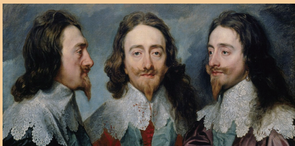
▲查理一世的三面畫像， 可以發現與寵臣的風格非常類似

(...for the handsomest gentleman and the most elegant cavalier of France or England.)」由於當時沒有照片可供參考，大家就將就看看畫家繪製的肖像畫吧！