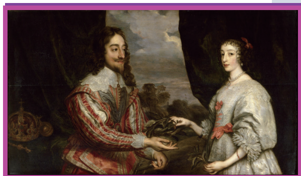
▲查理一世與他的天主教皇后亨利埃塔·瑪麗亞 (Henrietta Maria) 這位皇后是法王路易十四的姑姑

然而，剛剛繼任英國國王的查理一世 (Charles I)，卻破壞了這種國會與國王間的傳統。當時的查理一世為了參加歐洲大陸上的宗教戰爭，需要大量金錢，於是他忽視國會的警告，濫用國王的收稅權，甚至發動所謂的「強制借款」，向人民、各種機構（例如銀行、商行）徵收錢財供國王的軍隊使用，這讓國會議員們非常不滿；此外，查理一世娶了一位法國的天主教公主為皇后，這也讓國會的議員擔心國王可能會偏向天主教，並開始迫害英國本土的宗教改革派。