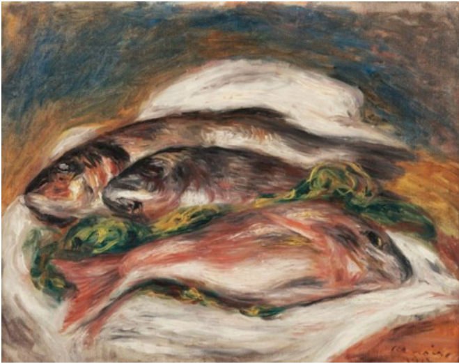
價值約新臺幣 2.2 億元的雷諾瓦作品《魚》。