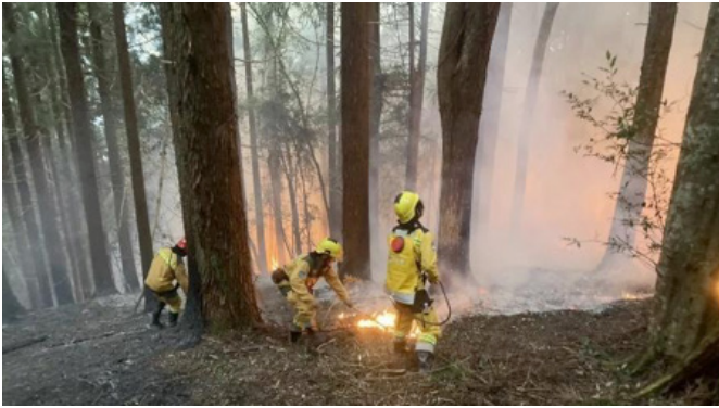
消防人員搶救森林火災。

中央氣象署預測，今年春天降雨偏少，森林變得很乾燥，容易發生火災，農業部林業及自然保育署（簡稱「林保署」）也提出警告，臺中、南投、嘉義、臺南、高雄和屏東等 6 縣市的山區火災風險已明顯上升，部分地區甚至達到危險等級。林保署指出，每年 10 月到隔年