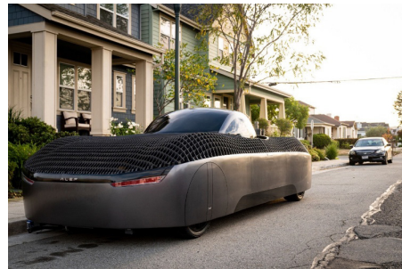
Alef 公司推出的電動飛行車。

美國新創公司 Alef Automotive 研發出全球首款電動飛行車 Alef Model Zero，2023 年取得美國聯邦航空總署的「特殊飛行認證」，並於 2025 年 2 月 19 日公開試飛影片。影片中，Alef Model Zero 沒有用任何繩索牽引，在一般道路上垂直起飛，越過地面上的一輛車後順利降落。該公司表示，目前正積極研發用於上市的 Alef Model A 車款，可乘坐 2 人，適合在城市行駛，其耗能低於特斯拉等他牌電動車，電池的地面駕駛續航力約為 322 公里，飛行續航里程則為 177 公里，預估售價 30 萬美元（約新臺幣 983 萬元）。研發團隊已與波音和空中巴士的航空零件製造商簽訂合約，以供應未來飛行車所需零件，同時將持續進行飛行測試，透過軟體模擬與數據分析來進一步完善技術，目標是在 2025 年底進入量產階段。