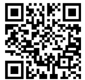
掃 QR code 觀看試飛影片