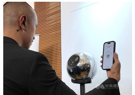
World 應用程式透過 Orb 球體設備掃描眼睛虹膜，以驗證使用者身分。

OpenAI 執行長阿特曼創立的科技公司 Tools for Humanity (TFH) 近期在印尼推出數位身分驗證應用程式 World，可用於辨識網路世界中的真人與 AI，有助解決數位虛擬世界中的身分盜竊、AI 變造生成虛假影音等相關問題。World 應用程式是結合實體 Orb 球體設備，進行虹膜掃描這種生物識別技術，以區分使用者為真人或 AI，無須收集姓名、地址或身分證號碼等私人資訊。除了身分驗證功能外，World 應用程式也能有效辨識網路上由 AI 生成的假新聞和假評論，進而降低假訊息的傳播。目前這項應用程式已在日本、韓國、馬來西亞、新加坡等全球 20 多個國家推出，其創新的技術不僅為網路安全提供了新的解決方案，同時為打擊 AI 相關的網路犯罪增添新的助力。