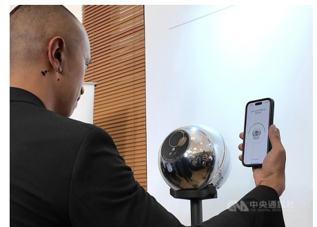
World 應用程式透過 Orb 球體設備掃描眼睛虹膜，以驗證使用者身分。

OpenAI 執行長阿特曼創立的科技公司 Tools for Humanity (TFH) 近期在印尼推出數位身分驗證應用程式 World，可用於辨識網路世界中的真人與 AI，有助解決數位虛擬世界中的身分盜竊、AI 變造生成虛假影音等相關問題。World 應用程式是結合實體 Orb 球體設備，進行虹膜掃描這種生物識別技術，以區分使用者為真人或 AI，無須收集姓名、地址或身分證號碼等私人資訊。除了身分驗證功能外，World 應用程式也能有效辨識網路上由 AI 生成的假新聞和假評論，進而降低假訊息的傳播。目前這項應用程式已在日本、韓國、馬來西亞、新加坡等全球 20 多個國家推出，其創新的技術不僅為網路安全提供了新的解決方案，同時為打擊 AI 相關的網路犯罪增添新的助力。