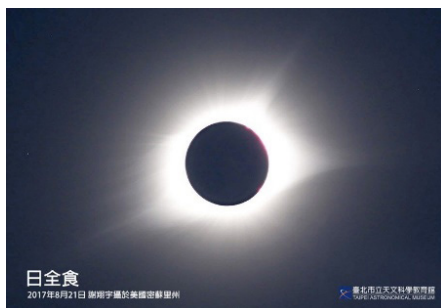
2017 年美洲日全食影像

美國國家航空暨太空總署 (NASA) 2018 年發射「帕克太陽探測器」繞日飛行，負責收集有關太陽的各項數據並傳送回地球，協助科學家更深入了解太陽。12 月 24 日，「帕克太陽探測器」執行第 22 次任務時，以時速 69 萬公里的速度衝進太陽大氣層最外層的日冕，飛到距離太陽表面僅 610 萬公里的地方，承受高達 980°C 的高溫進行探測，改寫了人類探測器最接近太陽的紀錄。NASA 表示，「帕克太陽探測器」2025 年預計會再執行 2 次飛越太陽的探測任務，科學家期待它近距離測量到的數據有助人類研究太陽日冕高溫的形成原理，以及其他與太陽相關的問題。