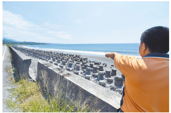
消波塊佔據的海岸線景觀

自然保育與環境資訊基金會 11 月 15 日公布「九大美麗海岸 2023 年現況踏查報告」，指出臺灣目前只有 23.3% 的海岸為純天然、沒有人工設施，其餘海岸則存在著消波塊、港口、風力發電機等人造設施，有的甚至被各種垃圾及海洋廢棄物佔據。根據研究，消波塊雖可阻擋海浪，但人工堤岸不僅無法聚集沙子，海浪的衝擊甚至會帶動消波塊加重侵蝕海岸，導致海岸線不斷後退，而為了阻擋海浪又再投放更多的消波塊，形成惡性循環。因此，該基金會建議政府使用生態工法來保護海岸，例如天然竹籬、離岸潛堤等，並呼籲政府應落實「自然海岸零損失」政策，與民間的力量結合，共同努力來保護臺灣美麗的海岸。