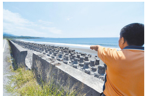
消波塊佔據的海岸線景觀

自然保育與環境資訊基金會 11 月 15 日公布「九大美麗海岸 2023 年現況踏查報告」，指出臺灣目前只有 23.3% 的海岸為純天然、沒有人工設施，其餘海岸則存在著消波塊、港口、風力發電機等人造設施，有的甚至被各種垃圾及海洋廢棄物佔據。根據研究，消波塊雖可阻擋海浪，但人工堤岸不僅無法聚集沙子，海浪的衝擊甚至會帶動消波塊加重侵蝕海岸，導致海岸線不斷後退，而為了阻擋海浪又再投放更多的消波塊，形成惡性循環。因此，該基金會建議政府使用生態工法來保護海岸，例如天然竹籬、離岸潛堤等，並呼籲政府應落實「自然海岸零損失」政策，與民間的力量結合，共同努力來保護臺灣美麗的海岸。