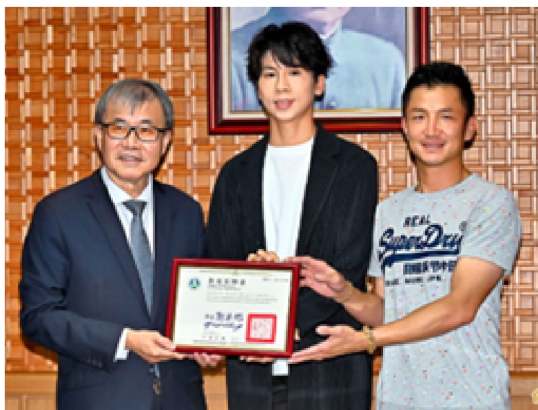
教育部長(左)頒發反霸凌公益大使聘書給林郁婷(中)，教練曾自強(右)一同出席。

每學期的開學首週為「友善校園週」，教育部為了推動校園霸凌防制，特別聘請巴黎奧運拳擊女子 57 公斤級金牌選手林郁婷擔任反霸凌公益大使，一起宣導反霸凌。教育部長指出，林郁婷在奧運比賽期間無端捲入性別爭議，遭受到外界許多不實指控與網路攻擊，但她仍頂住所有壓力、穩住心態，最終贏得金牌，希望藉由林郁婷的經歷，能讓大家認識到反霸凌的重要性，並以她為榜樣，在受到外界的攻擊和壓力時，能夠用健康的心態及方式去應對。林郁婷則表示，接下反霸凌大使的任務很沉重，因為無論是校園、職場或家庭都可能發生霸凌事件，未來她希望分享自己的親身體悟，讓人們知道霸凌是不對的，並能一起努力讓霸凌事件不再發生。