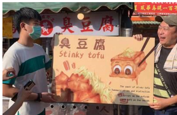
壽山國中學生幫臭豆腐店家設計雙語藝術菜單。

高雄哈瑪星代天宮廟埕夜市有許多傳統小吃，吸引很多外國遊客前往嚐鮮，然而攤商大多不諳英語，無法清楚地向外國客人介紹自己販賣的食物，客人們也無法理解中文菜單與價目表，甚感困擾。由於壽山國中鄰近代天宮商圈，有學生的家人就在附近開店，學生因此向老師反映這個問題，於是該校「雙語快樂購」社團的學生在中外師的協助下，為攤商們翻譯菜單、附上食材和做法的英文介紹，再加上美術班學生巧手為小吃繪製圖樣，共同打造出深入淺出且具美感的雙語藝術菜單供攤商使用。壽山國中的校長對師生們結合課程學以致用、為社區服務的用心給予高度的肯定，該校的英文老師則表示，這次「雙語快樂購」社團的行動在口耳相傳下，還收到其他店家的雙語菜單翻譯請託，讓學生們充滿成就感，也讓他們成了另類的國民美食外交達人。