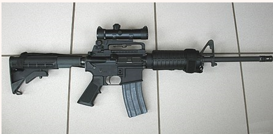
AR-15 步槍。

這群修女們的修會來自密西根州、加州、馬里蘭州、賓州以及奧勒岡州，顯然美國很多的修女們希望槍枝受到更嚴格的管制。這是很容易了解的，畢竟修女們是愛好生命的。