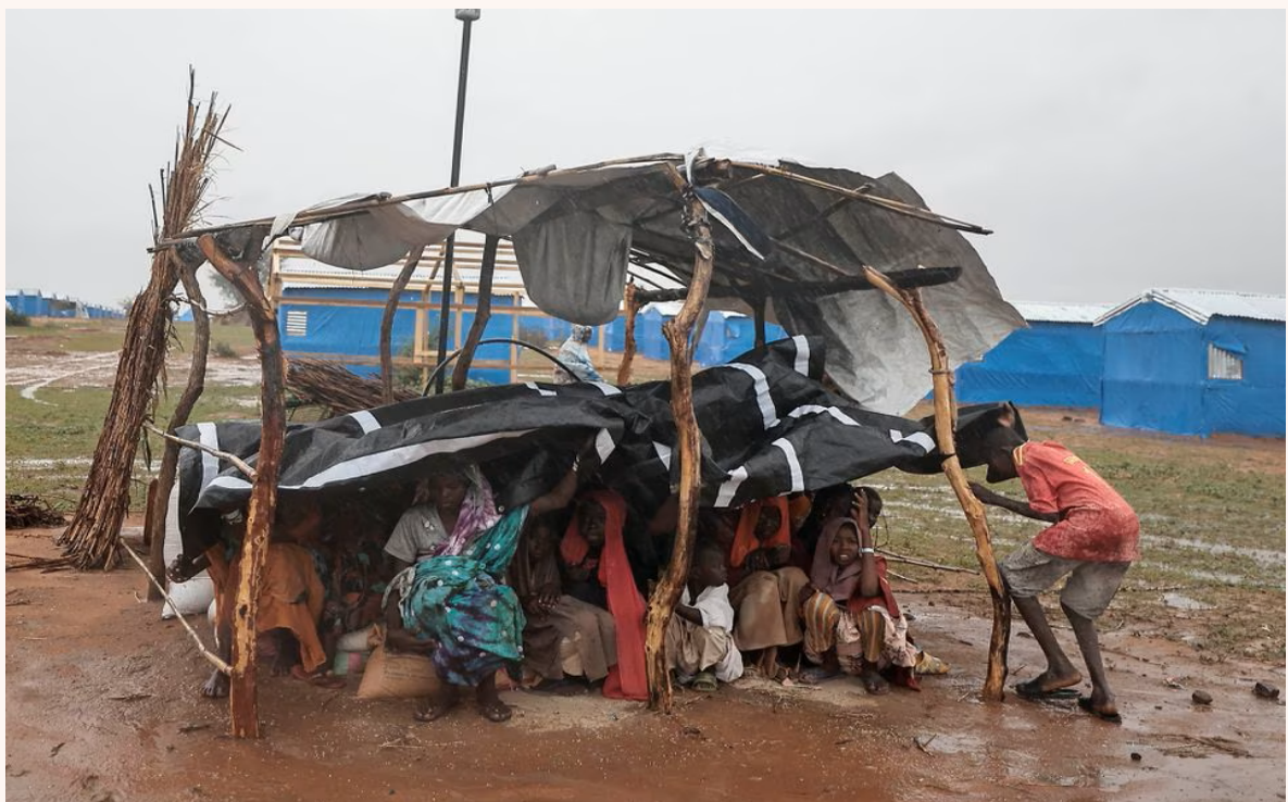
↑大雨來臨前，難民尋找庇護的景象。