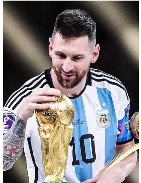
↑ 梅西與世足賽冠軍盃

2022 年世界盃足球賽已經落幕，本屆賽事由阿根廷拿下冠軍，法國拿下亞軍，克羅埃西亞獲得季軍。本屆賽事創下許多紀錄，包含主辦國卡達斥資 2300 億美金在沙漠中建立起一座城市，搭建 8 座球場以及周圍的飯店、購物中心等；摩洛哥在歐洲、南美洲等傳統足球強權稱霸的世界級殿堂上，成為第一支踢進 4 強的非洲及阿拉伯國家隊。阿根廷國家隊的靈魂人物萊納爾·梅西 (Lionel Messi) 本屆帶領阿根廷國家隊獲得世足賽冠軍金盃，讓阿根廷全國陷入瘋狂，比賽後數百萬的民眾湧入首都齊聚歡慶，阿根廷政府也於 12 月 19 日下午緊急宣布隔天為國定假日，讓全國民眾一同迎接阿根廷足球國家隊歸國，共享這個睽違 36 年的冠軍盃榮耀。