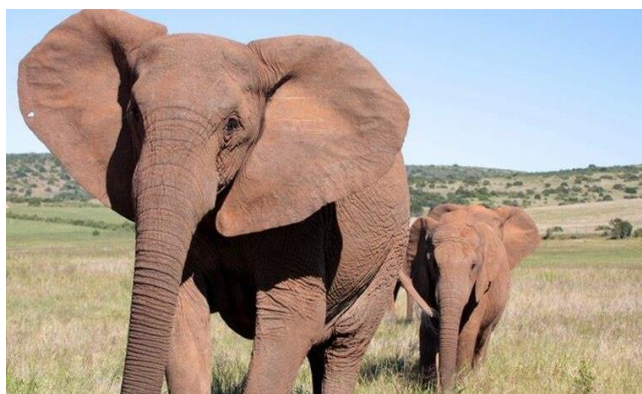
▶ 非洲無牙象圖片。

象牙盜獵活動在非洲的莫三比克極為猖獗，尤其在 1977 年至 1992 年的內戰期間最為嚴重，武裝部隊在這段期間屠殺了 90% 有象牙的大象，並將象牙變賣以資助戰爭。一份發表在《科學》（Science）期刊上的研究指出，經過長時間的象牙盜獵活動後，倖存下來的無象牙大象將遺傳特徵傳給後代，導致在莫三比克的戈龍戈薩國家公園內出生時即沒有象牙的母象數目比例日漸增長，但公象幾乎都有象牙，表示此現象仍與性別有關，也顯現人類的行為正在改變野生動物的自然演化。