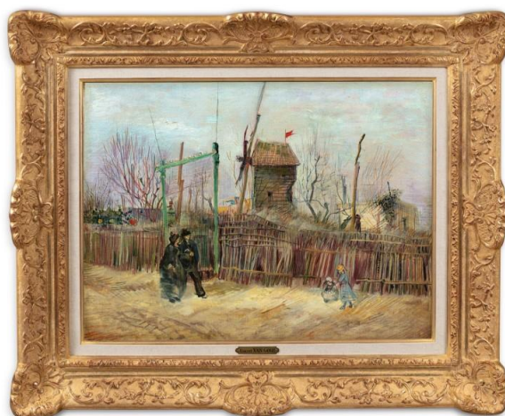
▲ 梵谷的《蒙馬特街景》畫作。

印象派畫家梵谷以自由奔放的筆觸著名，雖然梵谷生前不得志，但是他的多幅作品在 20 世紀時卻獲得巨大的迴響，這些作品大多被收藏在世界各地的博物館中。然而，25 日下午在巴黎展開的蘇富比拍賣會上竟然出現了一幅隱藏了百年，從未出現過的梵谷作品——《蒙馬特街景》，引起世界各地梵谷迷的高度關注。據悉，這幅畫作在完成後就被一位法國收藏家與他的家族收藏至今，最後該畫作在第二次競標時以約台幣 4 億 4183 萬元落槌，這也是梵谷作品在法國拍賣場上賣出的最高價。