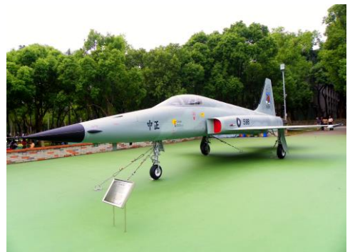
▲ 中華民國空軍的 F-5E 戰機。

為美國於 1962 年推出的輕型戰機，本機型著重在空中的作戰能力，中華民國為 F-5 系列戰機最大的使用者。