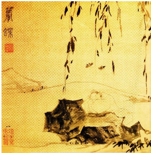
明代陸治所繪〈夢蝶〉

對於這個哀戚的故事，現在的學者推測可能是因為杜鵑鳥的口腔上皮和舌頭都是紅色的，古人才誤以為牠啼叫到滿嘴流血。但無論如何，千百年來，杜鵑鳥在眾多文人的筆下，已經變成了愁苦哀思的象