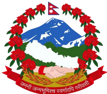
▲尼泊爾的國徽外綴有一圈國花杜鵑花

清明連假正好是杜鵑花開的季節，原本我和姐姐計畫好要帶妳去台北大安森林公園的杜鵑花節賞花，但現在只有妳們兩個能去了。其實，為了去賞花，我還特地做了一些功課呢！像是杜鵑花又叫映山紅、滿山紅，不僅是台北市和新竹市的市花，更是尼泊爾的國花喔！