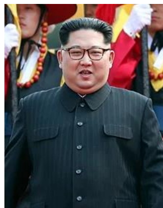
北韓領導人金正恩▶

現年 36 歲的北韓領導人金正恩自 108 年 8 月以來便因為吸菸、肥胖及過勞等因素導致心血管出現問題，也造成他的健康狀況每況愈下。近來，CNN 引述一名美國官員的談話表示，金正恩疑似在做完心血管手術後仍處於「嚴重危險」的病危狀態中。對此，南韓官方媒體《韓聯社》報導，北韓目前沒有出現異常動靜，有關消息可能不屬實。