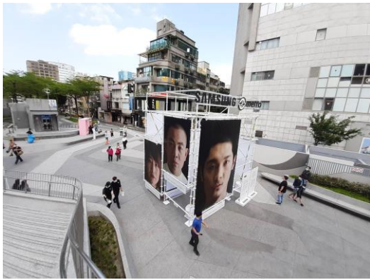
▲位於「心中山」線形公園 2 層樓高的肖像照裝置藝術。

台灣三星電子與台北捷運公司合作，自 4 月 11 日起，於捷運中山站及雙連站間的「心中山」線形公園舉辦為期一個月的「顛覆攝影展」，並豎立了 2 層樓高的肖像照裝置藝術，邀請台灣當代攝影家使用三星手機的 1 億 800 萬畫素相機拍攝照片。展出的照片捕捉了捷運淡水線沿線的風景，富含台灣獨特文化，並將街頭的塗鴉、霓虹燈等台灣特色風景一一收錄。