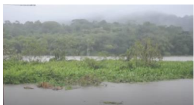
▲巴拿馬洪流中漂流的樹島。

根據 CNN 報導，科學家在南美洲國家秘魯的一項化石研究中發現，一群已經滅絕、原本僅分布於非洲的靈長類動物，在約 3500 萬年前的一次颱風期間乘坐樹島穿越約 1450 公里的大西洋，抵達現今的秘魯一帶，並在亞馬遜河流域定居。南加州大學教授塞弗特（Erik Seiffert）表示，自己過往一直很難相信動物可以飄洋過海，但在看過巴拿馬因暴雨產生洪流的影片之後，認為這確實可能發生。