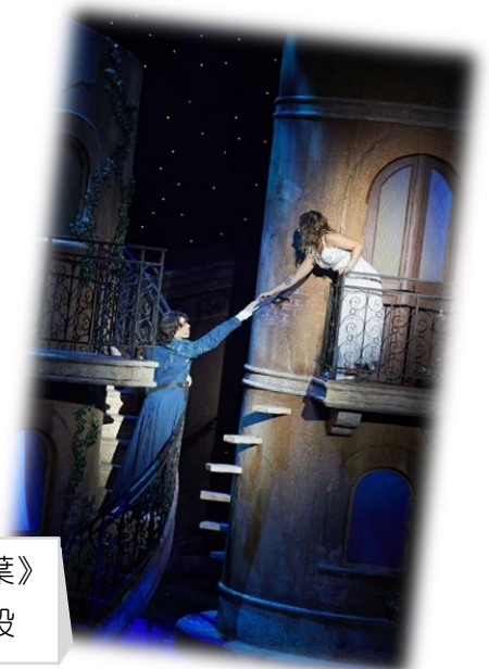
《羅密歐與茱麗葉》 法文音樂劇片段

茱麗葉：啊！千萬不要對著月亮發誓，月有陰晴圓缺，你若對著它發誓，愛情也會像它一樣無常。