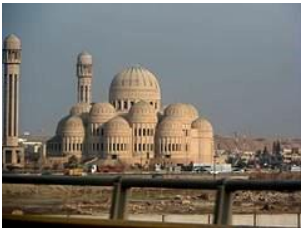
▲昔日的伊拉克摩蘇爾城

伊拉克於本月 1 日爆發反政府示威，原因在於民衆不滿政府迂腐，以及高達 25% 的青年失業率，導致民衆自主上街抗爭，要求政府改善公共服務，訴求工作「權利」。結果卻造成人民與政府當局爆發嚴重衝突，短短 5 天內死亡人數就破百人，並有高達 6100 多人受傷，死傷人員當中也包含 1000 多名軍警。除了傷亡外，還有 51 棟公共建築與 8 間政黨總部遭到抗議人士放火焚燒。儘管當局承諾改革，卻以武力鎮壓示威民衆，讓這場示威活動愈演愈烈。