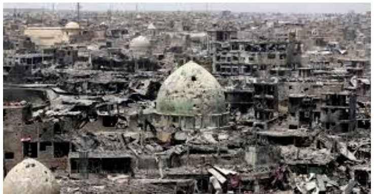
▲今日的伊拉克摩蘇爾城