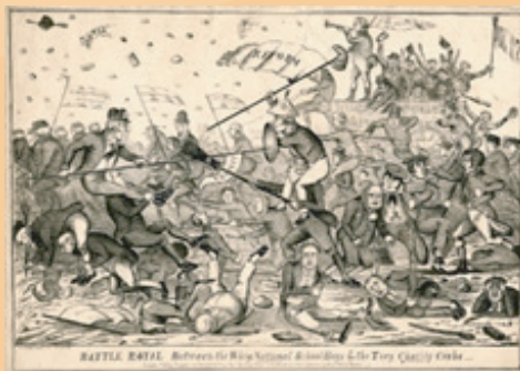
▲輝格與托利的兩黨戰爭

輝格Whig一詞的來源是「驅趕牲畜的 巴佬」(whiggamore) 簡稱，是反對者對他們的攻擊；而托利一詞的來源也是如此，Tory源於古愛爾蘭語，意思是不法者、強盜。但這兩派政治人物後來也都樂於以這樣的詞彙自稱，可以說是英國政治諷刺傳統的代表。