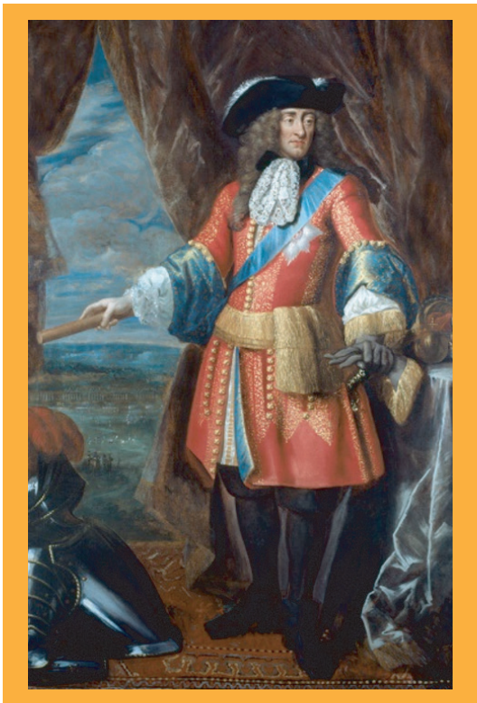
▲身穿軍裝的詹姆士二世

回頭說這次衝突原因，是王位繼承的天主教徒身分，這個問題雖然沒有根本解決，但是查理二世確保國會保守的托利黨佔優勢，讓詹姆士在查理之後，能夠有保守黨的支持順利繼承王位，成為詹姆士二世。