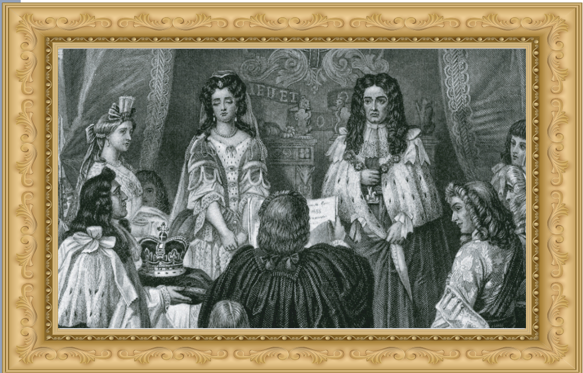
▲光榮革命：國會對新任國王宣讀權利法案