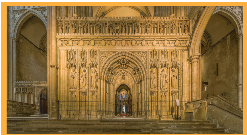
▲富麗堂皇的坎特伯理教堂是英國信仰的中心

他沒有查理的圓融，也沒有查理的深謀遠慮，在即位之後，不斷拒絕對國會立場讓步，固執地任命天主教徒擔任官員，甚至開除、逮捕反對天主教徒的英國主教、官員，讓原本支持國王的保守黨國會也開始反彈，結果不到一年的時間，詹姆士就與國會反目，並解散了國會。在這位天主教國王的統治之下，宗教問題越來越嚴重，導致了革命的發生。