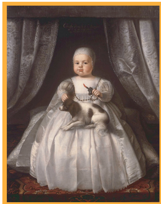
▲查理二世童年的畫像