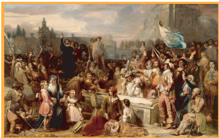
▲蘇格蘭人起義宣誓圖， 地點是愛丁堡的灰衣修士墓園

上回我們提到，查理一世因為不願意受國會的限制，因此長達十幾年拒絕召開國會，結果當蘇格蘭人集結軍隊提出他們的宗教要求時，查理只能在沒有國會支持下去開戰，表面上國王指揮英國大軍，實際上，這些軍隊中除了少部分效忠國王的貴族外，大部分反而比較同情蘇格蘭的起義者，英格蘭軍隊的士氣低落到連國王查理自己都不敢真的對蘇格蘭人發動決戰，最後灰頭土臉地連正面會戰都沒發生，就與蘇格蘭人談和妥協。