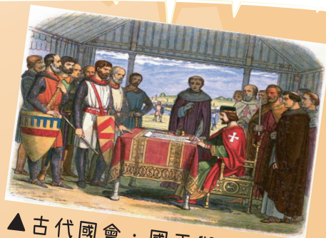
▲古代國會：國王與貴族軍人

國會一開始，跟法國大革命中提到的三級會議很像，是國王為了找人幫忙，特別召開的會議，換句話說，只要國王不需要，國會也不會召開。