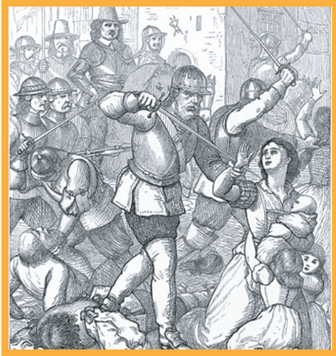
▲傳說中克倫威爾的軍隊在愛爾蘭迫害平民

沒有制衡的力量下，克倫威爾帶領的英格蘭政府是暴力的，他們打壓天主教徒，在1649年發動大軍侵入天主教徒為多數的愛爾蘭，造成軍人與平民合計將近百萬人的喪生；為了消滅國王的勢力，侵略蘇格蘭，反過來迫害支持國王的人們，強制地把三個王國合併為一個國家。