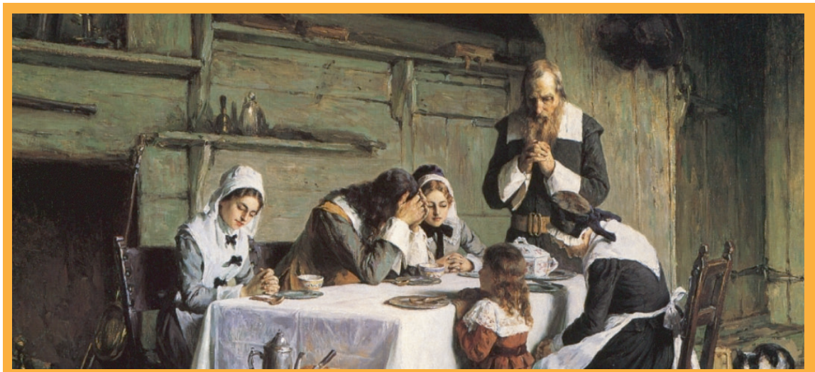
▲清教徒生活的典型，宗教的、勤儉的、樸素的

在1660年，英格蘭重新建立新的國會，迎接查理一世的繼承人查理二世回國，再次建立英格蘭王國與君主的體制。