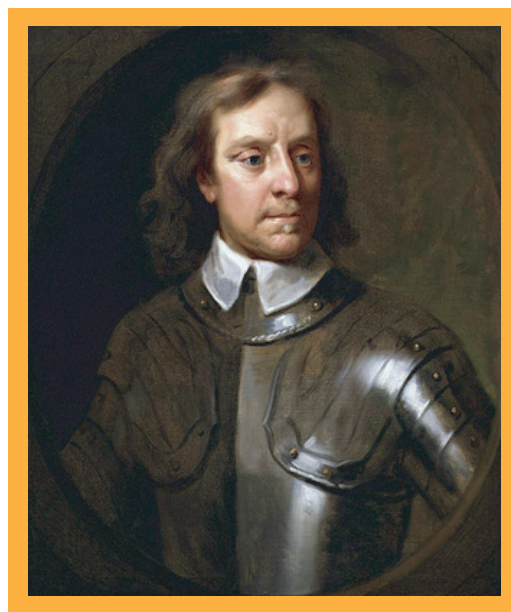
▲新模範軍領導人奧利佛·克倫威爾拒絕擔任國王、用護國公稱號(Lord Protector)

主導新政府的新模範軍是一群有著宗教理想，紀律嚴明的軍人，他們的目標明確：建立一個清教徒的偉大國家，在這個目標之下，新模範軍推舉一位名為奧立佛·克倫威爾(Oliver Cromwell)的將軍成為國家的領導人，並宣告英國成為一個共和國，不再需要國王。國會也進一步被削弱，僅剩為軍政府應聲的功能，失去表達不同意見的能力。