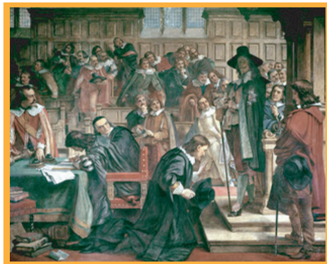
▲查理一世帶兵進入國會下議院 下議院議長拒絕國王的命令

局勢的發展超出了預期，查理無法繼續與國會共存，在一次嘗試武力逮捕國會成員的行動失敗後，他離開國會控制的首都倫敦，跑到北方的鄉間舉旗對國會宣戰，真正的英格蘭王國內戰就此開始。