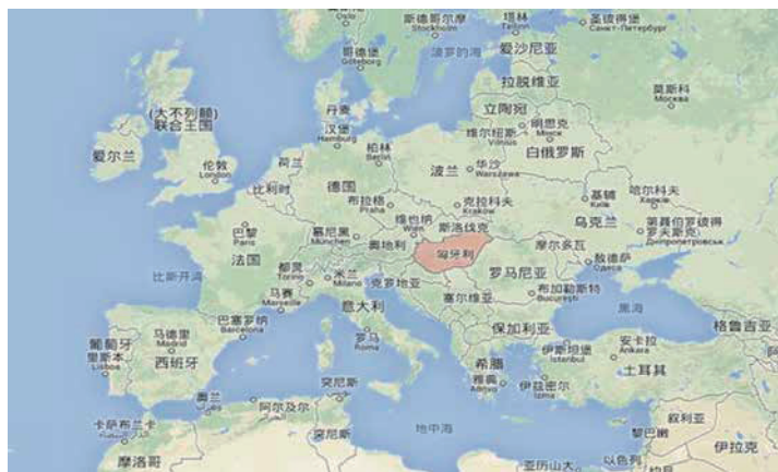
▲ 現代歐洲國家，大多是民族國家

經歷拿破崙戰爭後，這些地區都開始出現人民與國家是一體的想法，也可以說是主權在民的雛形。