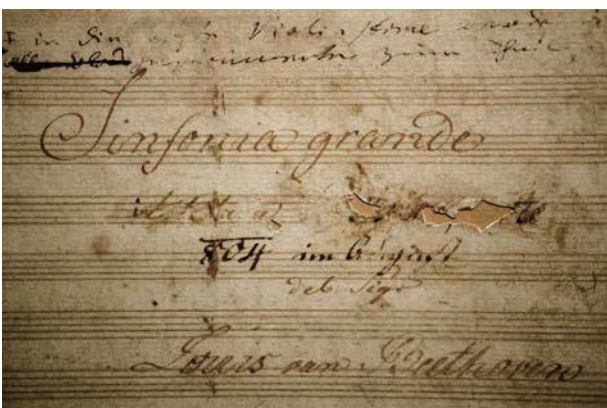
◀ 標題被塗毀的英雄交響曲封面

貝多芬居住在所謂「德意志地區」，當時還沒有德國存在，這裡是許多小的王國、侯國，並受到一個稱為「神聖羅馬帝國」的封建皇帝支配，拿破崙解散了這個帝國，並建立以「日耳曼民族」為基礎的聯邦，換句話說，拿破崙也是現代德國建立的推手之一。