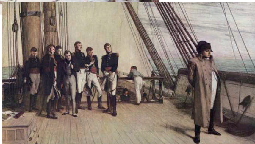
▶ 遭到放逐的拿破崙