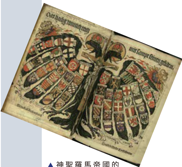
▲ 神聖羅馬帝國的紋章，上面有許多小國家的旗幟

神聖羅馬帝國 就是被拿破崙所破壞，許多傳統的封建國家，也都因為拿破崙戰爭帶入法國大革命思想，產生新的民族國家主義與革命運動。可以說歐洲現代國家的發展，是拿破崙帶著革命思想席捲歐洲而產生。