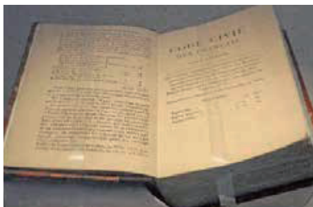
▲ 收藏於德國博物館的拿破崙法典