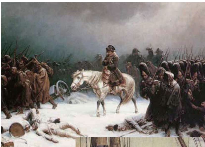
▲ 俄羅斯戰敗的拿破崙

拿破崙最後的失敗，也就來自於無法真正讓歐洲人民與他合作，每當他在一邊戰勝，另一邊就又出現敵人。當拿破崙遠征俄羅斯失敗後，原本臣服的各個國家都起身反抗，聯合攻擊法國，此後拿破崙再也沒能重現過去橫掃歐洲的戰績，先後在萊比錫與滑鐵盧兩場戰爭中失敗，最後被流放到海上的小島，結束他的一生。