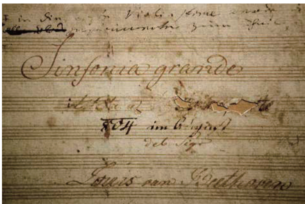
◀ 標題被塗毀的英雄交響曲封面

貝多芬居住在所謂「德意志地區」，當時還沒有德國存在，這裡是許多小的王國、侯國，並受「神聖羅馬帝國」的封建皇帝支配，拿破崙解散這個帝國，並建立以「日耳曼民族」為基礎的聯邦，換句話說，拿破崙是現代德國建立的推手之一。