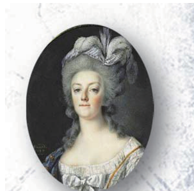
▶ 瑪麗皇后 法國大革命前的法國皇后，是來自神聖羅馬帝國的公主，成為反法國大革命的象徵，也遭斷頭台處死。