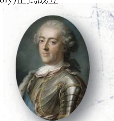
▶ 路易十六 法國大革命前的法國國王，由於無法解決法國社會矛盾，導致大革命發生，後來遭斷頭台處死。