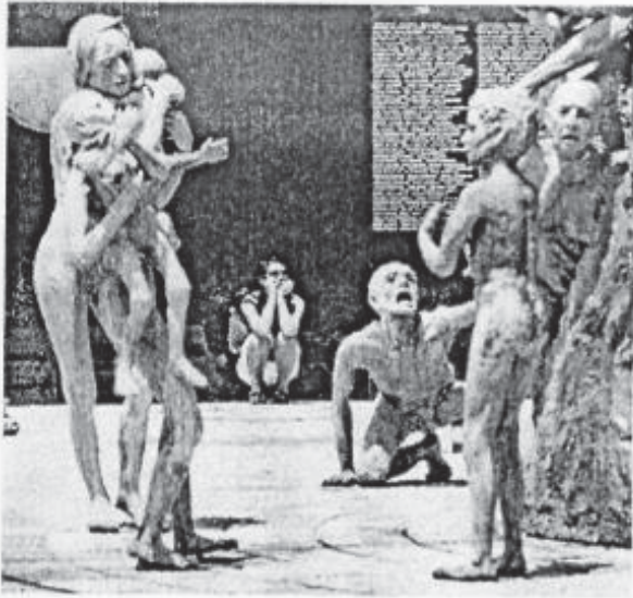
猶太人大屠殺紀念館

我覺得這一張圖很有特色，因為這張圖有很多各式各樣的表情，也有我們沒看過的英文字。