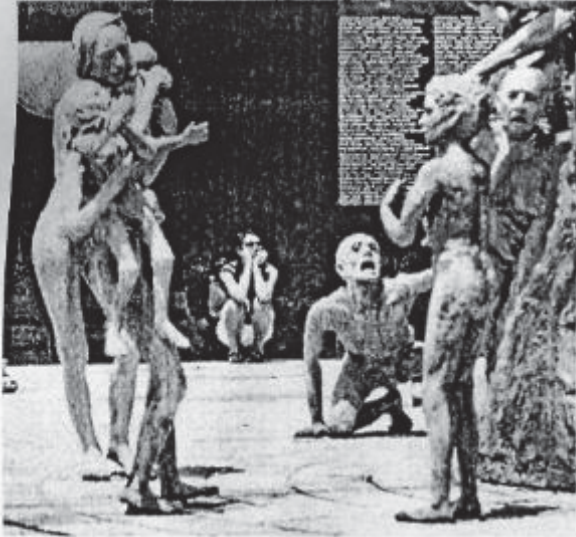
柏林猶太人屠殺紀念館