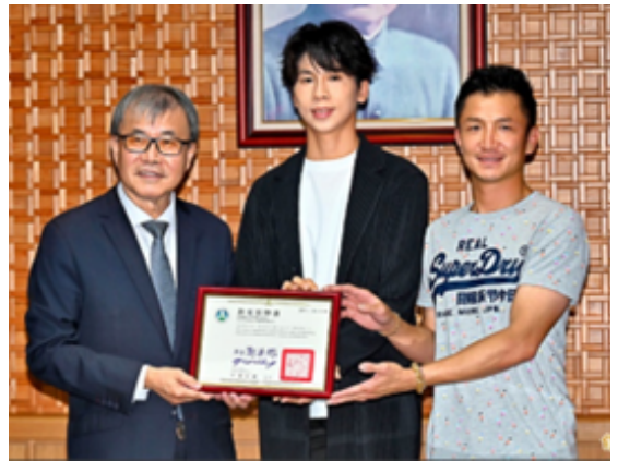
教育部長(左)頒發反霸凌公益大使聘書給林郁婷(中)，教練曾自強(右)一同出席。

每學期的開學首週為「友善校園週」，教育部為了推動校園霸凌防制，特別聘請巴黎奧運拳擊女子 57 公斤級金牌選手林郁婷擔任反霸凌公益大使，一起宣導反霸凌。教育部長指出，林郁婷在奧運比賽期間無端捲入性別爭議，遭受到外界許多不實指控與網路攻擊，但她仍頂住所有壓力、穩住心態，最終贏得金牌，希望藉由林郁婷的經歷，能讓大家認識到反霸凌的重要性，並以她為榜樣，在受到外界的攻擊和壓力時，能夠用健康的心態及方式去應對。林郁婷則表示，接下反霸凌大使的任務很沉重，因為無論是校園、職場或家庭都可能發生霸凌事件，未來她希望分享自己的親身體悟，讓人們知道霸凌是不對的，並能一起努力讓霸凌事件不再發生。