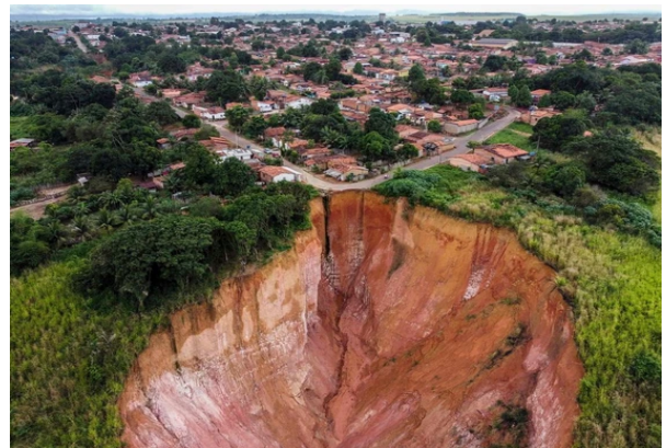
→ 布里蒂庫普地區的巨大坑洞。

巴西東北部的布里蒂庫普位於高原地區，多年來受到過度砍伐森林以及無規劃都市擴張的影響，導致當地面臨嚴重的山體滑坡跟土地侵蝕問題，產生超過 26 條溝渠，總長度達 298 公尺，其中最大的溝渠深達 70 公尺，宛如一個巨大的隕石坑，20 年來已經有 7 人掉入坑洞內死亡，至少 3 條街道與 50 多間房屋慘遭吞沒。地質專家警告，若不採取行動，該地區可能在 30 到 40 年內被夷為平地。根據調查，當地的樹木覆蓋面積在 20 年內減少了 41%，在植被大幅減少的情況下，一旦豪雨來襲，土壤沖刷的情況將更加嚴重，當地政府也被迫在雨季來臨前宣布該地區進入公共災難狀態，積極的尋找解決方案來解決當地的問題。