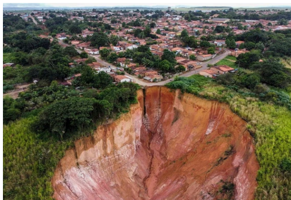
→ 布里蒂庫普地區的巨大坑洞。

巴西東北部的布里蒂庫普位於高原地區，多年來受到過度砍伐森林以及無規劃都市擴張的影響，導致當地面臨嚴重的山體滑坡跟土地侵蝕問題，產生超過 26 條溝渠，總長度達 298 公尺，其中最大的溝渠深達 70 公尺，宛如一個巨大的隕石坑，20 年來已經有 7 人掉入坑洞內死亡，至少 3 條街道與 50 多間房屋慘遭吞沒。地質專家警告，若不採取行動，該地區可能在 30 到 40 年內被夷為平地。根據調查，當地的樹木覆蓋面積在 20 年內減少了 41%，在植被大幅減少的情況下，一旦豪雨來襲，土壤沖刷的情況將更加嚴重，當地政府也被迫在雨季來臨前宣布該地區進入公共災難狀態，積極的尋找解決方案來解決當地的問題。