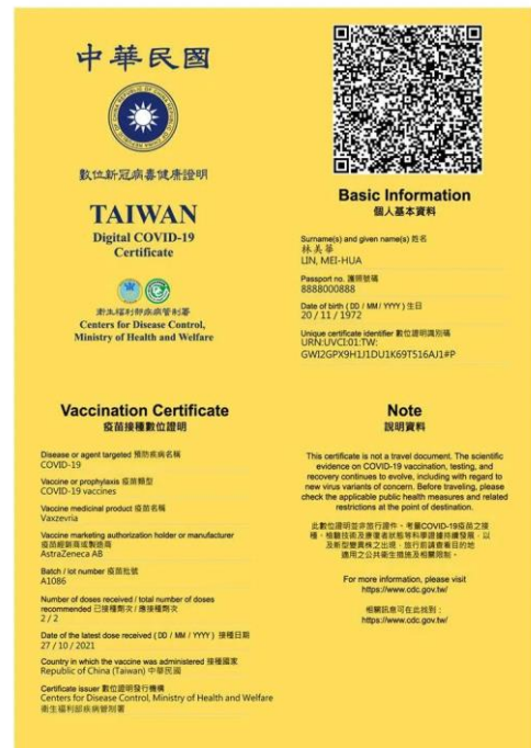
▲數位新冠病毒健康證明。

經歐盟機構技術評估後，歐洲經貿辦事處（EETO）21 日公布承認台灣核發的「COVID-19（2019 冠狀病毒疾病）疫苗接種證明書」與歐盟核發的「歐盟數位 COVID-19 證明」具同等效力，並於 12 月 22 日生效。自 28 日起，只要是持有接種紀錄卡的國內民眾都可以至「數位新冠病毒健康證明」網頁，確認身分、選擇欲申請的數位證明種類後，即可下載數位證明 QR Code。持有數位接種證明的民眾在入境歐盟國家時僅需出示 QR Code，即可快速比對施打的疫苗廠牌，通過比對後接續進行入境檢疫隔離程序，相較於以往的入境程序還要方便快捷許多。