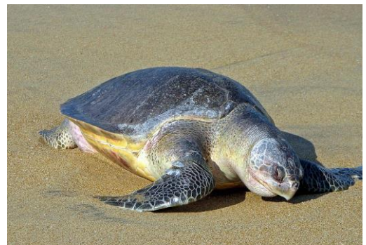
▲欖蠟龜圖片。(圖片來自維基百科共享資源)

欖蠟龜的特色是身上的顏色為橄欖綠，成年欖蠟龜身長逾 50 公分、重約 38 公斤，母龜可在 24 小時內產下約 90 顆卵，孵卵需花 40 至 70 天。每 100 隻欖蠟龜幼龜中，有 90 隻得以回歸海洋，但只有 3 隻能存活到成年。