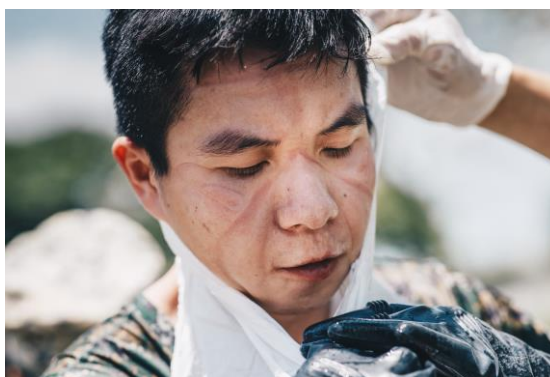
▲ 化學兵臉上留下戴防毒面具的痕跡。