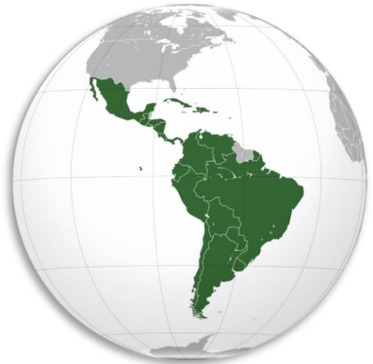
拉丁美洲在世界的位置▶

今年 2019 年為聯合國教科文組織所訂定的「國際本土語言年」，目標設定在結合政府和民間資源，以保護拉丁美洲僅存的六百種本土語言。當前本土語言所面臨的困難大部分在於社會歧視、全球化，以及科技等因素，使得其中 170 種語言正面臨消失危機。其實，近五百年來，拉丁美洲國家就因西班牙與葡萄牙殖民者的強化統治，使其語言多樣性不斷遭侵蝕，光是巴西就已經失去超過一千種本土語言。聯合國教科文組織的墨西哥代表瓦契隆說道：「語言的消失不僅語言本身，還有其視角、豐富的文化行為與世界觀。」